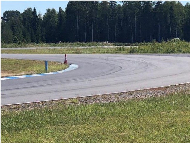
RT piste 4