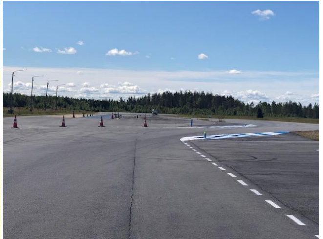
RT piste 6 shikaani